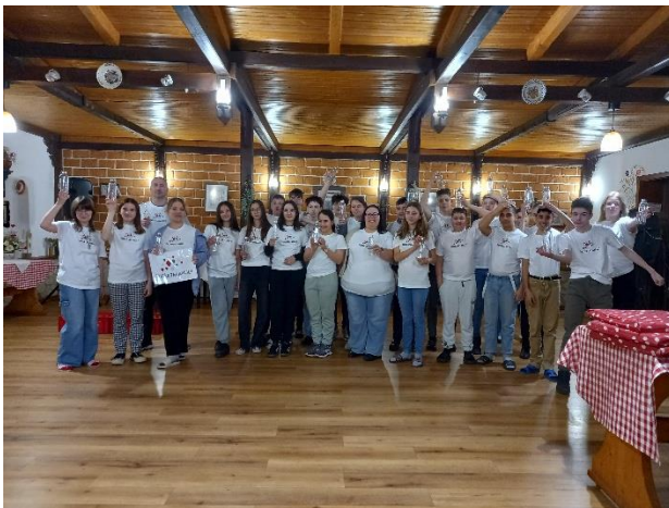
pólók és kulacsok

Határtalanul! Barangoló digitális tartalomtár használata az előkészítő órákon