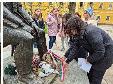
koszorúzás a szobornál