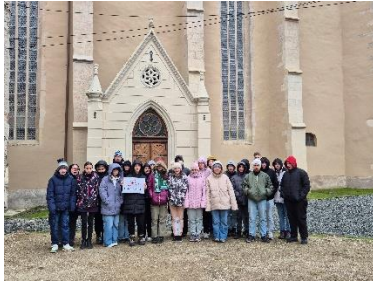
Nagyenyedi vár udvara