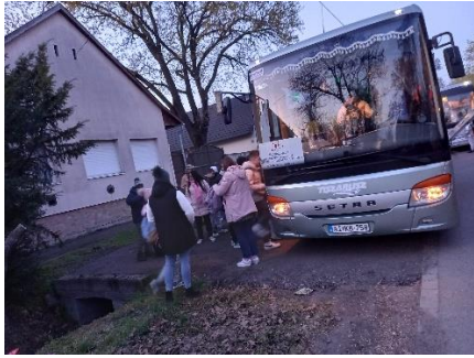
az indulás pillanatai