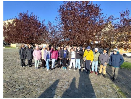
első megállónk, Arad